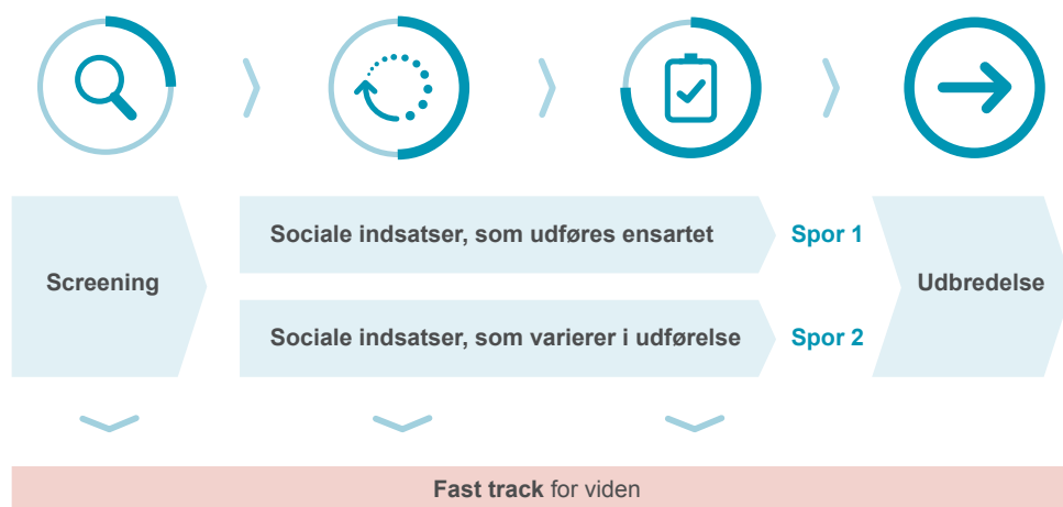
Figur 3. Fasemodellen i SUSI 2.0

Udvidelsen af fasemodellen sker på baggrund af efterspørgsel fra kommunerne og skal gøre modellen mere fleksibel, så den i højere grad kan rumme samarbejde om for eksempel en mere helhedsorienteret indsats, der tager udgangspunkt i borgerens situation på tværs af traditionelle siloer i kommunerne. Med udvidelsen kan strategien også rumme udvikling og implementering af for eksempel en ny fælles faglig tilgang, som implementeres forskelligt afhængig af lokal kontekst. Initiativerne i det nye spor 2 kan således være ret forskelligartede og kan for eksempel handle om udformning af den samlede kommunale indsats for en målgruppe, indsatser til koordinering på tværs af forvaltninger og sektorer eller udbredelse af et fagligt paradigme.