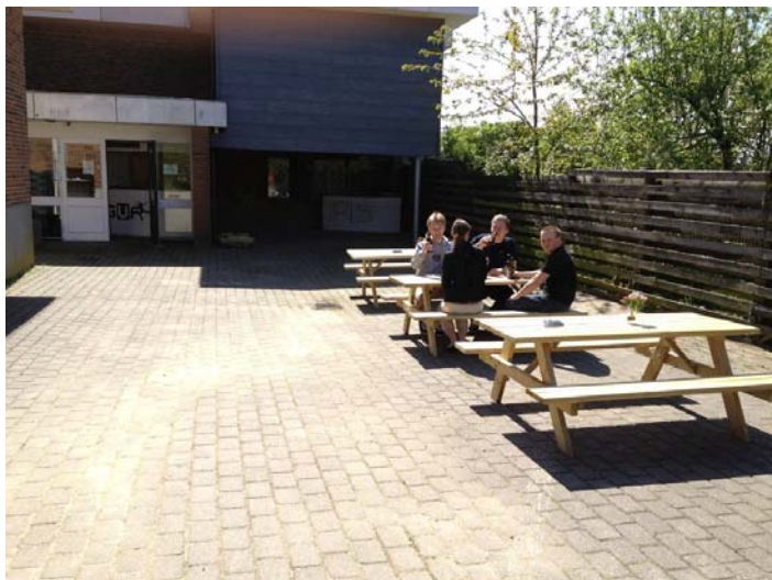
De unge finder, at det forhenværende diskotek Downstairs, som ligger i samme bygning som hallen, vil være velegnet som deres sted. Her ses indgangen og nogle af de unge.

De unge har altså som en start dannet et Glyngøre Ungdomsråd (GUR), hvor en lille gruppe unge i alderen 14-25 er drivkræfter for at få et værested som er deres eget.