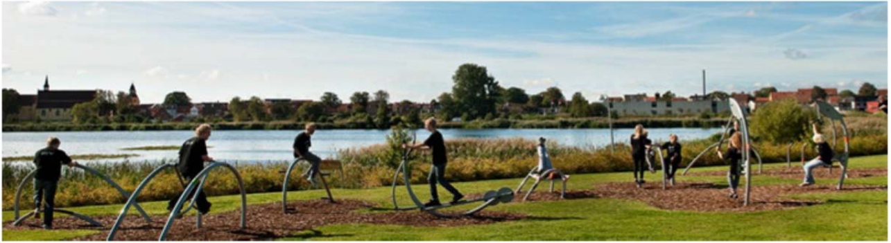
Udendørs fitnessområde med udsigt over søen

Materialet sendes til kommunen sammen med to ansøgninger om to konkrete projekter: fornyelse af multibane og etablering af udendørs fitness-område. Begge ansøgninger henviser til de unges deltagelse og indflydelse, men også til at projekterne skal være med til at trække tilflyttere til området, og at det skal kunne bruges af alle.