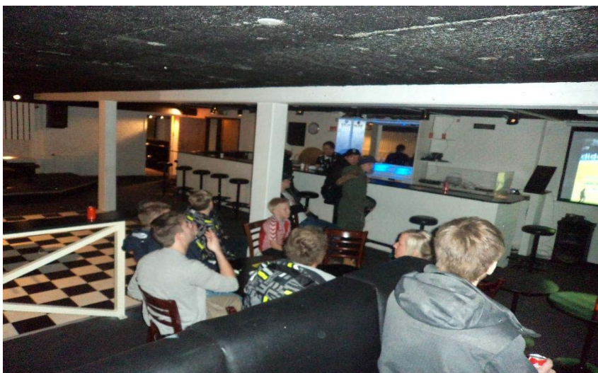
Der ses EM i håndbold på storskærm i GUR's lokaler i Glyngøre

Dette projekt adskiller sig fra de andre projekter ved, at vi har at gøre med en meget aktiv gruppe unge, der i forvejen har defineret, hvad de vil og kæmper for at få det opfyldt gennem projektdeltagelsen med stor støtte fra projektlederen og lokalsamfundet. De unge er ældre end i de andre projekter – mange af dem