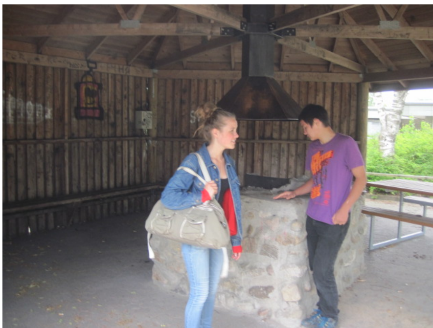
De unge i projektgruppen viser den gamle bålhytte frem

”Vi har ikke haft indflydelse på, hvad det blev til – nej, for de voksne valgte selv, hvad det skulle blive til, for vi kom ind bagefter. Men vi synes at det er ok, at det også skal bruges til andre, fx vi kan tage vores små søskende med på tarzanbanen, mens vi er ved bålhytten og andre børnehaver kan bruge det. Der er kun skolen som legeplads.”